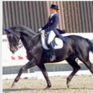
Dressur / Dressage