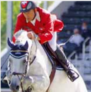
Springen / Saut

Vorstand Resultate Berichte • Comité Résultats Rapport