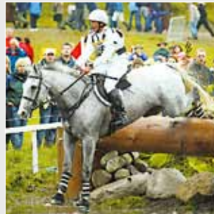
Military / Concours Complet