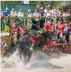
Fahren / Attelage